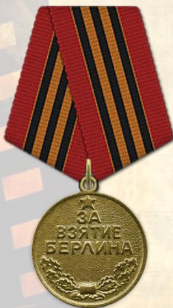
Медаль «За взятие Берлина»