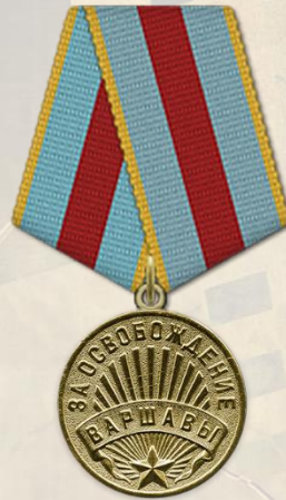
Медаль «За освобождение Варшавы»